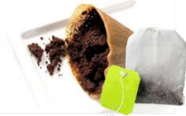
커피 찌꺼기, 커피 필터, 티백